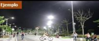
Alumbrado Público y Rehabilitación de Andadores