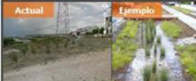
Jardines de Lluvia