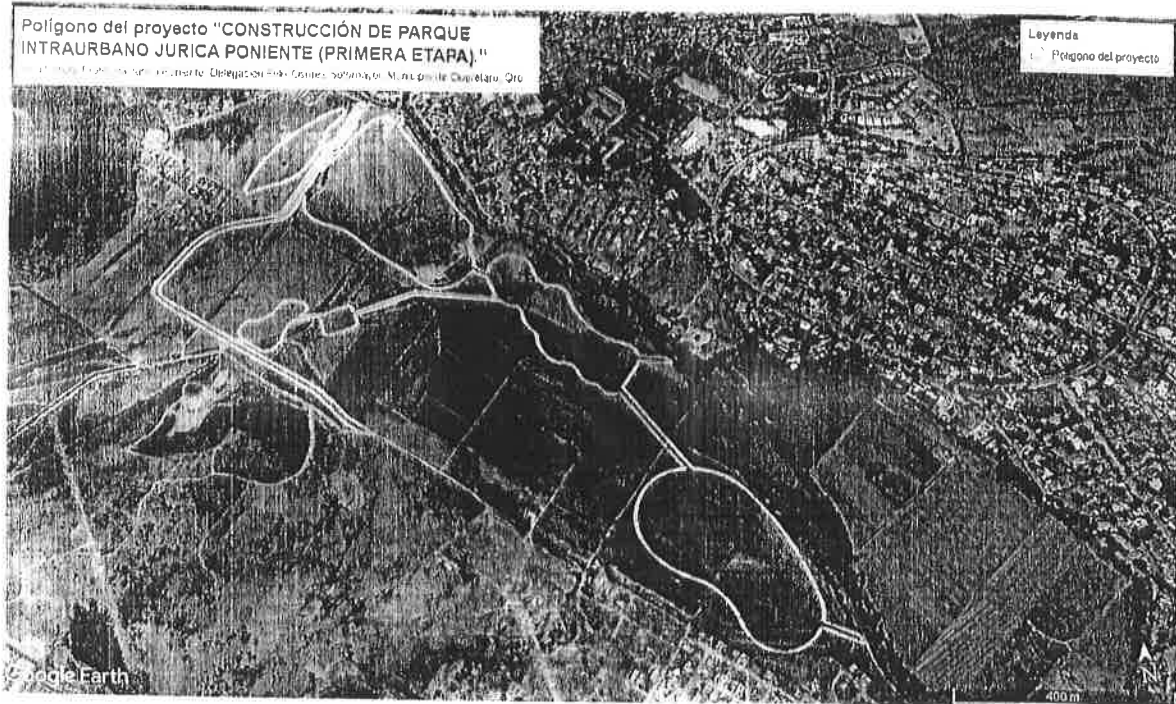
Figura 1. Imagen satelital del proyecto "CONSTRUCCIÓN DE PARQUE INTRAURBANO JURICA PONIENTE (PRIMERA ETAPA)."